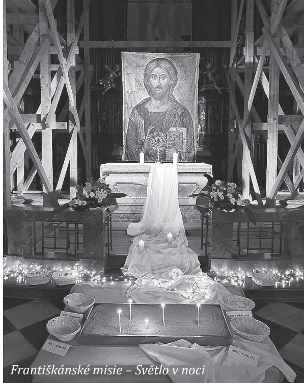
Františkánské misie – Světlo v noci

Ke chválám jsem se dostala asi přes scholu u nás ve farnosti, kam mě maminka přivedla v osmi letech. V patnácti jsem tam pak začala hrát na kytaru. Moc mě to bavilo.