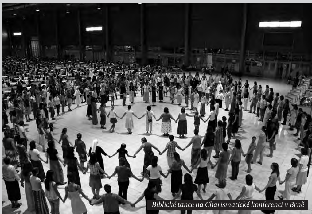
Biblické tance na Charismatické konferenci v Brně