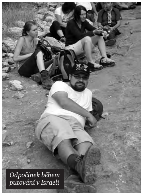
Odpočinek během putování v Izraeli

nás Bůh dotýká svou milostí – kdo upadl, dostává zde chuť znovu povstat... A je to velká kněžská radost, být prostředníkem a svědkem těchto nových „vylití Ducha“. Bůh tu působí „obousměrně“. Srozumitelně se zde svědčí o Ježíši (často z laických úst), zakouším v tom vanutí Ducha, ale také spoustu opravdové švandy a veselí (třeba při „Jump-crossu“).