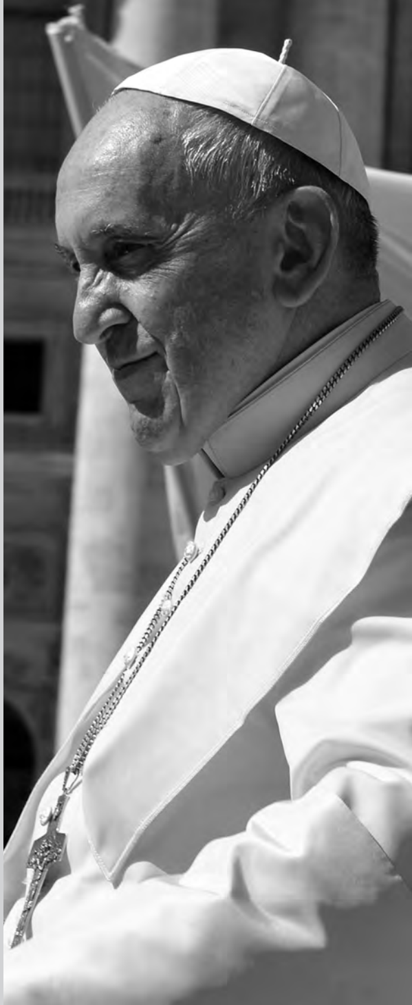
Papež František při návštěvě Bahrajnu, dne 6. 11.2022. Redakčně upraveno a zkráceno.