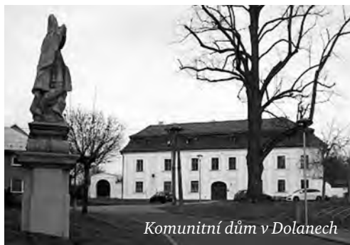
Komunitní dům v Dolanech